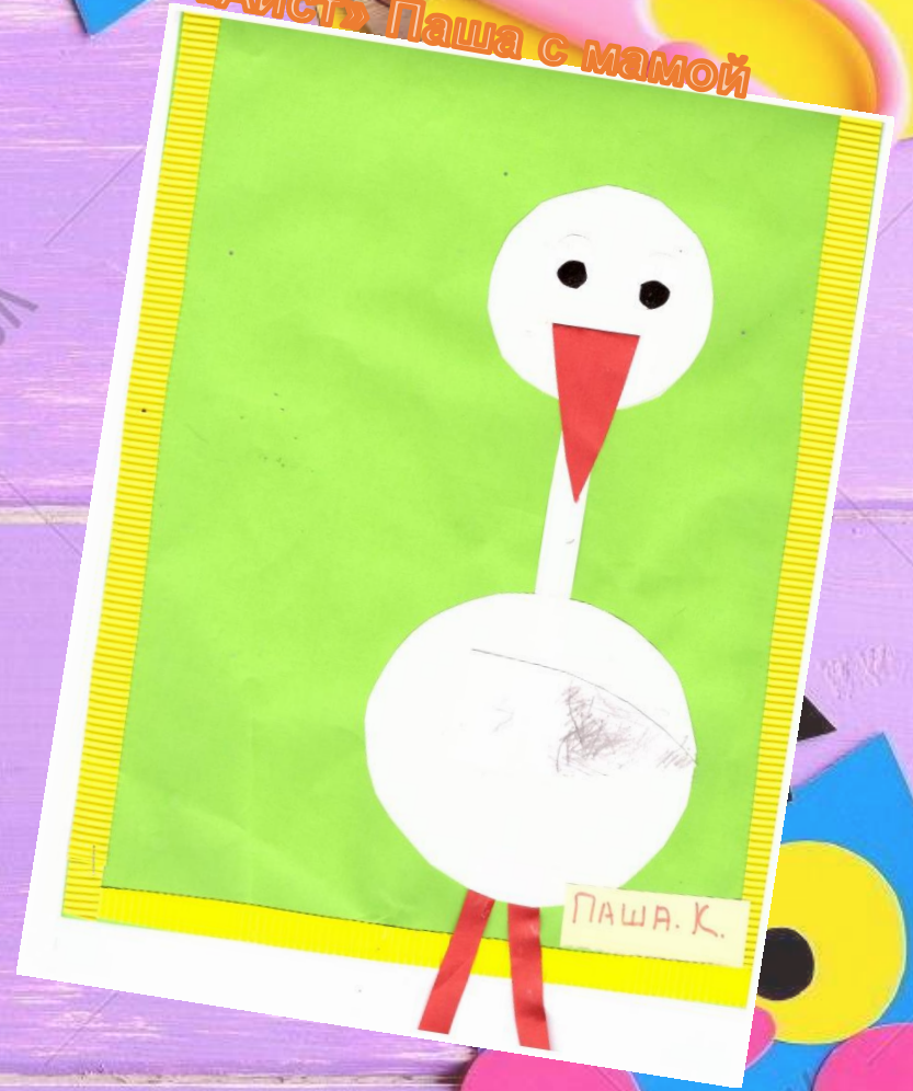
«Аист» Паша с мамой